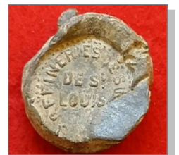
4 Plomb, pour sceller les sacs de sucre de la Société nouvelle des Raffineries de sucre de Saint-Louis à Marseille.

l'emballage était constitué par une simple feuille de papier qui se repliait sur les quatre côtés pour emprisonner le morceau de sucre, les extrémités réunies étant maintenues par une pastille dorée. La fabrication d'emballages et de sachets de sucre cessa en 1918. En effet, un décret du 12 janvier 1918 interdisait de servir du sucre dans les endroits publics.