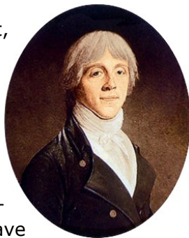
1 Benjamin Delessert.

Jules Paul Benjamin Delessert, né à Lyon le 14 février 1773 et mort à Paris le 1 er mars 1847 (1), est un homme d'affaires, naturaliste et industriel français. Il s'est rendu célèbre sous le Premier Empire par sa méthode d'extraction du sucre de la betterave