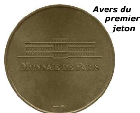
Avers du premier jeton

Ils sont disponibles dans les distributeurs de différentes couleurs. Leur installation est assujettie à la commande en quantité (10 000) de jetons ou sur les comptoirs dans les présentoirs.