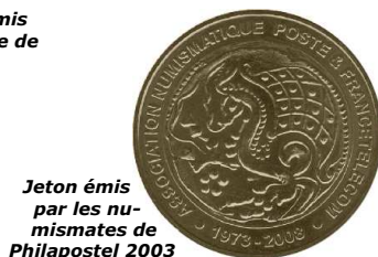
Jeton émis par les numismates de Philapostel 2003