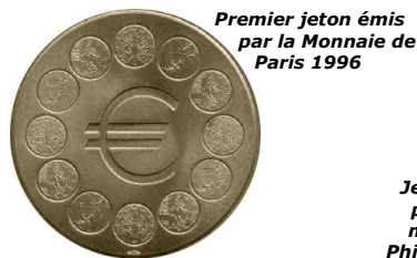
Premier jeton émis par la Monnaie de Paris 1996

La collection des médailles et jetons touristiques prend un essor important chez les collectionneurs. C'est une collection attrayante et abordable si l'on se contente de les chercher dans leurs lieux d'émission. Ils sont émis dans des sites touristiques importants ou discrets, mais aussi par des associations, des commerçants ou des organismes pour des événements. La diffusion de ces jetons a commencé en 1996 par la Monnaie de Paris ; Paris (75), Pierrelatte (26), Nîmes (30), Ganges (34), Le Mont Saint Michel (50), Boulogne sur Mer (62), Clermont-Ferrand (63) furent les premières villes ayant édité des jetons. D'autres villes suivront au cours des années, il a été recensé 2131 faces différentes, mais en tenant compte des rééditions avec changement de millésime, plus de 4291 jetons de la Monnaie de Paris ont été réalisés.