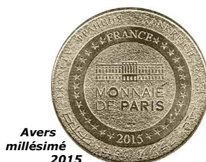
Avers millésimé 2015

D'autres éditeurs sont apparus au cours de ces années : - Société Arthus-Bertrand (A) fabricant de médailles à Paris