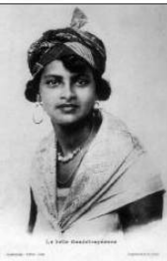
La belle guadeloupéenne

D'une superficie de 1.100km 2 , la Martinique, d'origine volcanique, est très montagneuse. Au nord culmine la Montagne Pelée (1.397 m). Au sud, les mornes ne dépassent