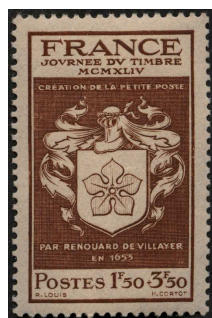
Dessiné par R. Louis Gravé par H. Cortot

Après la Seconde Guerre mondiale, qui a interrompu la « Journée du Timbre » dans son élan, le nombre de villes organisatrices - et le public- n'a cessé d'augmenter. Jusqu'à représenter de nos jours près de 100 villes et des milliers de participants réunis chaque année sur tout le territoire.