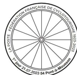
Timbre et TAD 1 er jour