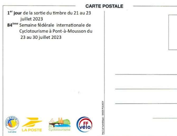
Verso carte postale