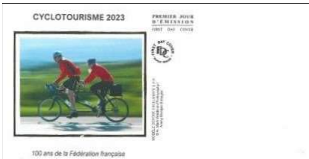
Enveloppe soie "Farcigny"