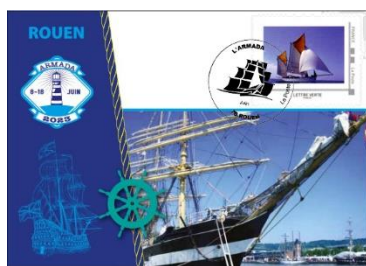
Carte postale n°1

Les timbres, édités par la poste en 2 collectors seront apposés sur les souvenirs avec le TAD du jour (il y en aura 1 nouveau chaque jour)